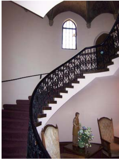
Schwieriger Drehort: Die Wendeltreppe im Dimitrov - Haus. Das Gebäude ist heute ein Tagungsort.

Michael unterstrich die Eintönigkeit, die sich bei der Arbeit bei Falcon Crest ausbreitete. „Wenn du etwa ein halbes Dutzend oder so der gleichen Serie gedreht hast, fiel Falcon Crest nach einer Weile in ein gewisses Muster. An diesem Punkt sagte ich zu mir selbst, dass ich immer nur das wiederholte, was ich immer und immer wieder gemacht hatte, und ich langweilte mich mit der Serie. Die einzige Ausnahme hatte ich mit Fame — Fame hatte immer die Musik, und das machte es interessant und es gab immer eine andere Herausforderung.“