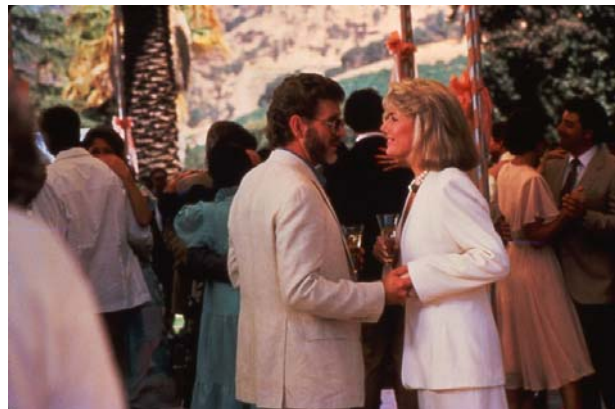
Robert Foxworth und Susan Sullivan während einer Party-Szene auf dem Gioberti Estate (Folge 130).

Ein Bild aus der 2. Staffel: Auf Lorenzos rechter Schulter erkennt man sehr gut sein Tattoo. Dies führte immer wieder zu Problemen, da die Zuschauer es nicht sehen sollten. Erst kurz vor Ende der Serie ließ Lance es sich auch offiziell in der Serie stechen.