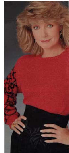
Susan Sullivan hat ihre Eigenarten — liefert aber immer perfekte Arbeit ab.

Dann fuhr er über die anderen Darsteller fort: „Weißt du, all diese Leute waren professionelle Schauspieler. Susan [Sullivan] und ich kamen anfangs nicht gut miteinander aus. Sie versuchte immer, mich herauszufordern, und ich erinnere mich, dass ich zu Bob Foxworth ging, der zu diesem Zeitpunkt — ich glaube, das war irgendwann in der Mitte des zweiten Jahres, in dem ich bei der Serie war — die Serie verließ, und ich sagte: ‚Bob, kannst du mir ein paar Anregungen geben, wie ich besser mit Susan auskommen kann?‘ Er sagte: ‚So ist sie halt, mein Freund. Du musst damit leben.‘ Dies war sein hilfreicher Rat, und ich ging zu Susan und sagte: ‚Können wir uns auf eine Art Arrangement festlegen, damit wir nicht gegenseitig so stark aufeinander losgehen?‘ Sie sagte: ‚Warum? Ich liebe das! Das ist der beste Weg, zu arbeiten!‘ Und ich begriff... ‚Oh, das ist okay...‘ Von diesem Zeitpunkt an kamen wir gut miteinander aus, und ich verstand, was sie sich dabei dachte — es war nicht notwendigerweise persönlich gemeint.“