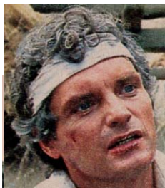
Szenen einer Jagd: In Episode 163 wird Richard von Hopkins durch die Wälder gejagt und schließlich in Channing Nevada gestellt.