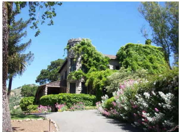
Links die Explosion des Gioberti - Hauses in Folge 159; rechts Stags' Leap Manor im Jahr 2010.

Während wir über die Requisitenabteilung sprachen, erinnerte sich der Regisseur plötzlich an ein sehr lustiges Ereignis.