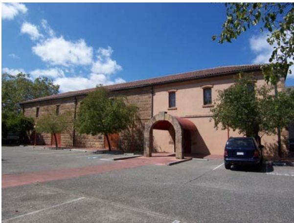
Die ehemalige Lisbon Winery in der Innenstadt von Napa wurde für unterschiedliche Drehorte genutzt: Die Front (links) als Valentino's in L.A., ein Seitenflügel als Terrasse des Tuscany Valley Inn .