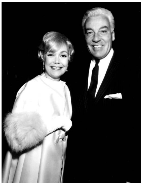
Jane und Cesar Romero verband eine lange Freundschaft: