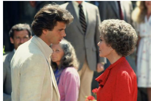
Angelas Beziehung zu Lance in der Serie nicht unähnlich (hier während Episode 20 <2.02>), hatte auch Jane manches Mal mit Lorenzo ein Hühnchen zu rupfen.