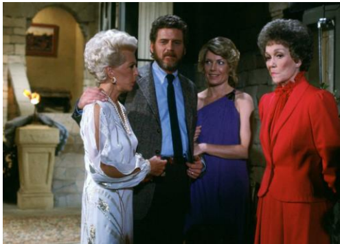
Dieses bislang unveröffentlichte Foto der Dreharbeiten zu Folge 12 zeigt, wie verärgert Jane während einer Reihe von Aufnahmen mit Lana war; in dieser Szene auf der Veranda des Gioberti-Hauses (Studio 19 in den Burbank Studios, jetzt Warner Bros. Studios).

toren, Ana - Alicias ursprüngliche Rolle, Melissa Agretti, aus der Serie zu schreiben — Lana Turner zu engagieren ein geschickter Schachzug war, denn es brachte der Serie eine Menge Aufmerksamkeit, und ihr Handlungsstrang und dessen Nachwirkungen verhalfen der Serie zu einer ganz neuen Dynamik, ganz speziell deshalb, weil Jacqueline